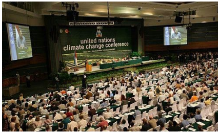
“巴厘岛路线图”通过大会

会议通过了《联合国人类环境会议宣言》，简称《人类环境宣言》，呼吁各国政府和人民为维护和改善人类环境，造福全体人民，造福后代而共同努力。