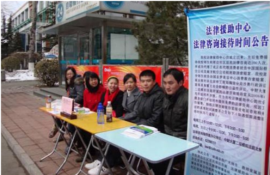
中央财经大学法律援助协会3.15普法活动

单位、几名法律工作者的事情，而需要倾全国之力，各个部门通力配合才能完成。保护消费者权益不仅关系到我国经济生活中消费这一环节是否能够健康有序地运行，还会影响国家经济的良性发展与和谐社会的构建。